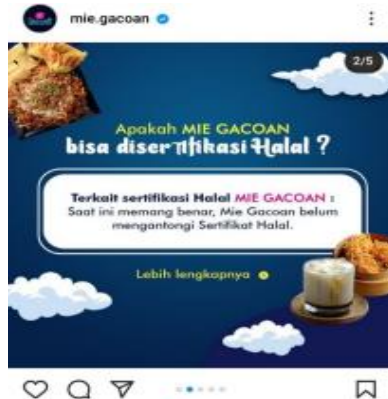
Gambar 5. Respon dari perusahaan Mie Gacoan

dalamnya dapat dengan mudah muncul dan berkembang (Fuadi et al., 2018).