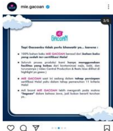
Gambar 6. Klarifikasi perihal kehalalan oleh perusahaan Mie Gacoan