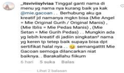
Gambar 4. Saran nama dari konsumen Mie Gacoan

sebagai jalan keluar dari suatu perkara yang terjadi.