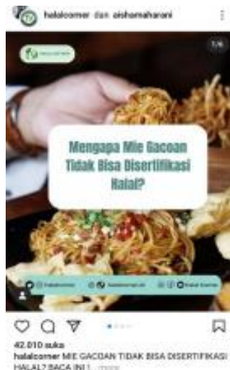
Gambar 1. Postingan @halalcorner mengenai Mie Gacoan yang belum Tersertifikasi Halal MUI (Sumber: Instagram @halalcorner)

istilah mie iblis dan mie setan untuk menunjukkan jenis dan tingkat kepedasannya, serta jenis tanamannya yang menggunakan nama-nama setan seperti es genderuwo, es tuyul, es pocong, dan es sundel bolong. Postingan ini bahkan juga melampirkan dalil Al-Qur'an dan juga hukum regulasi halal yang dibuat oleh MUI untuk memperkuat pernyataan yang disampaikan.