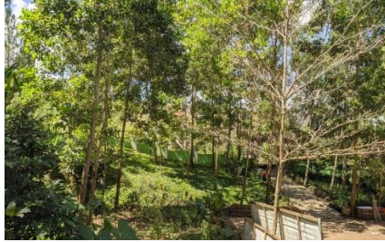
Pintu Masuk COC Danon

Desa Sengon mempunyai lokasi wisata yang paling banyak dikunjungi yaitu Wisata Goa Biru. Selain Wisata Goa Biru, Desa Sengon juga mempunyai wisata COC Danon. COC Danon merupakan wisata edukasi yang beralamat di RT. 04 RW. 02 Dusun Beji, Desa Sengon, Kecamatan Bendungan, Kabupaten trenggalek. Wisata edukasi adalah sebuah konsep perpaduan antara wisata dan kegiatan pembelajaran. Wisata edukasi dimaksudkan sebagai suatu program dimana para pelaku kegiatan wisata melakukan perjalanan wisata pada tempat tertentu dalam kelompok dengan tujuan paling utama untuk mendapatkan pengalaman belajar secara turun lapangan yang terkait dengan lokasi yang dituju.