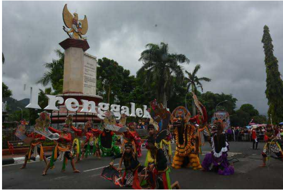
Seni Jaranan Turonggo Yakso

rias wajah dan kedudukannya yaitu sebagai tarian suci masyarakat Desa Sengon. Hingga saat ini kesenian rakyat tersebut masih dapat disaksikan dalam pergelaran rakyat, festival dan peringatan hari besar.