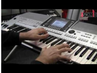
Alat Musik Organ Tunggal

Keyboard merupakan sebuah perangkat alat musik yang berupa jajaran bilah-bilah nada yang membentuk urutan tangga nada. Dimana didalamnya lengkap dengan modul-modul yang didengarkan oleh arus listrik untuk menghasilkan beberapa pilihan jenis irama yang akan digunakan, pilihan jenis-jenis warna suara, efek suara, dan juga memori penyimpanan data. sedangkan organ tunggal sendiri merupakan kegiatan memainkan berbagai komposisi musik yang hanya dilakukan oleh satu orang pemain, yakni pada alat musik organ (Hendro SD, 2010: 9).