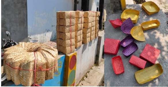
Besek Cantik Khas Sengon

menganyam besek di waktu luang mereka. Itung-itung juga menambah ekonomi keluarga.