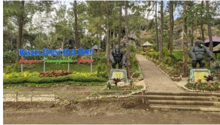
Pintu masuk Wisata Bukit Gua Biru

Bukit Gua Biru merupakan salah satu destinasi wisata yang terletak di desa Sengon, kec. Bendungan, kab. Trenggalek. Dimana wisata ini berada dalam jarak tempuh kurang lebih 7,5 kilometer dari pusat kota dengan waktu tempuh sekitar 15-20 menit dengan menggunakan kendaraan bermotor. Akses menuju lokasi objek wisata cukup mudah, namun terdapat beberapa lokasi jalan yang masih berupa tanah, selain itu jalannya cukup lebar, sehingga dapat dilalui kendaraan roda empat.