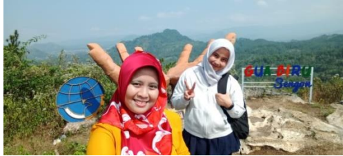
Puncak Bukit Gua biru

cerita tutur dari para terdahulu bahwa gua ini merupakan lokasi bertapa para sufi.