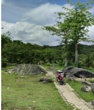
Suasana di Area dalam COC Danon

Wisata edukasi terbagi menjadi beberapa jenis antara lain ekowisata, wisata warisan budaya, wisata pertanian, wisata pedesaan dan wisata pelajar pendidikan. COC Danon merupakan wisata edukasi yang terfokus pada para pelajar. Di wisata COC Danon bisa menjadi sarana penambah pengetahuan bagi pelajar, karena di wisata tersebut terdapat berbagai jenis pohon dan bunga. Yang paling banyak adalah pohon pinus, pohon pinus di wisata tersebut dimanfaatkan dengan cara diambil getahnya, getah pinus tersebut kemudian diolah untuk menghasilkan gondorukem dan terpentin.