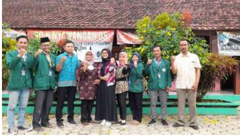
Foto Dengan Kepala Sekolah SDN 3 Nyawangan