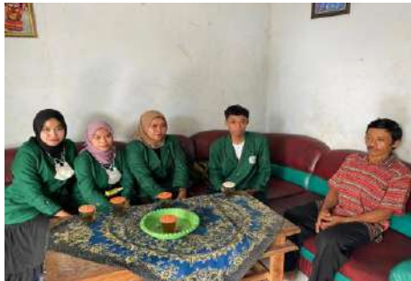
Foto mengajar di sekolah SDN di desa nyawang

Proses Wawancara dengan tokoh masyarakat desa nyawang.