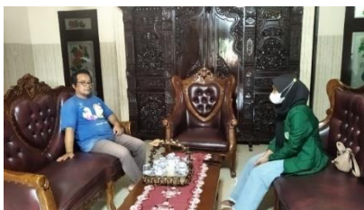
Gambar 1 (Survey dengan salah satu tokoh agama)

Masyarakat Sumberingin Kidul juga masih memegang adat isitiadat ataupun kebudayaan. Misalnya saja kenduri untuk menempati rumah baru, kenduri untuk melepas orang yang mau bekerja di luar negeri, kenduri untuk sapi yang baru lahir, dan lain sebagainya. Menurutnya adat isitiadat tersebut adalah perwujudan atau artikulasi dari unsur bersedekah yang diajarkan dalam agama islam, namun dibungkus dengan kebudayaan. Jadi, selama budaya tersebut tidak bertentangan dengan agama islam, masyarakat masih mempertahankan. Namun, kalau sudah melenceng maka ditinggalkan. Bahkan, masyarakat Sumberingin Kidul sekarang ini lebih modern atau lebih islami. Misalnya, pada zaman dahulu sebelum menggelar hajatan maka dilakukan kegiatan mageri dengan meletakkan sesuatu di pojok-pojok rumah. Namun, sekarang ini diganti dengan acara puasa. Kemudian, untuk selamat orang hamil sudah mulai dibiasakan dengan membaca ayat-ayat Al-Qur'an.