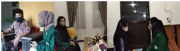
Wawancara dengan tokoh masyarakat

Dengan demikian, toleransi sangat penting untuk diterapkan dalam hidup di masyarakat. walaupun berbeda tetapi tetap sama. Toleransi beragama mengajarkan kepada kita pentingnya menghormati dan menghargai keyakinan setiap individu. Selain itu, budaya desa juga menjadi tali pengikat kita dalam toleransi beragama. Budaya harus tetap ada sampai pada anak cucu kita. Itulah cerita singkat yang saya ketahui di masyarakat Sumberingin Kidul.