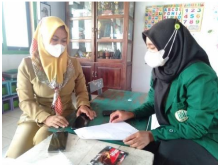
Gambar 3 (survey dengan tokoh masyarakat)

Selain itu, untuk melatih anak bersikap moderat dalam beragama maka orang tua disarankan agar tidak mencotohkan kekerasan dalam hal apapun. Sebab, anak tidak pandai untuk mendengar tapi sangat pandai untuk meniru. Jika dari kecil yang dilihat hanyalah kekerasan maka dapat dipastikan di masa depan anak tersebut cenderung lebih mudah untuk melakukan tindakan kekerasan termasuk dalam beragama (Niken Silvia).