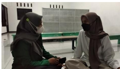
Gambar 2 (Survey dengan salah satu tokoh pemuda)

membahayakan. Jika seseorang sudah radikal, maka cenderung bersikap keras terhadap apa yang berbeda darinya. Oleh karena itu, IPNU IPPNU di Desa Sumberingin Kidul terus mengupayakan agar pemudanya memiliki jiwa moderasi dalam beragama dan tidak memiliki paham yang radikal ataupun liberal .