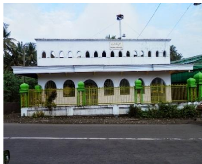
Gambar 1. Masjid Riyadhul Jannah