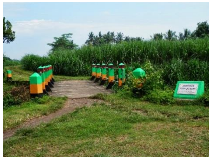
Gambar 3. Jalan dan Jembatan TEMPURSARI