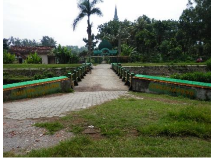
Gambar 2. Jalan dan Jembatan PODO