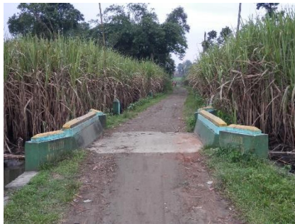
Gambar 5. Jalan dan dua jembatan PODO RUKUN