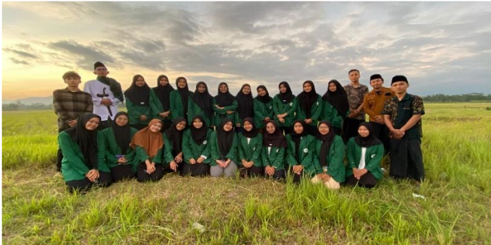
Gambar 4. Potret ziarah makam sesepuh Desa Karangnom