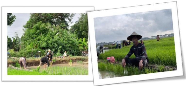
Gambar 3. Kegiatan warga dalam mengelola lahan pertanian

menghasilkan produk yang baik pula. Selain itu para perangkat desa juga berharap jika masyarakat di Karangnom bisa mengenal teknologi pertanian yang semakin berkembang, sehingga suatu saat nanti mereka mampu beralih dari pertanian tradisional ke modern yang lebih efisien. Bapak Harly, salah satu perangkat sekaligus pengelola tanaman di MTS menuturkan jika perawatan tanaman yang ada di MTS menggunakan pupuk dari bahan-bahan alami, dengan alat-alat pertanian hidroponik yang memadai. Digunakannya pupuk alami ini bertujuan untuk mengurangi persentase/kadar pemakaian pupuk kimia sehingga tanaman yang dihasilkan dapat terjamin kualitasnya dan aman untuk dikonsumsi.