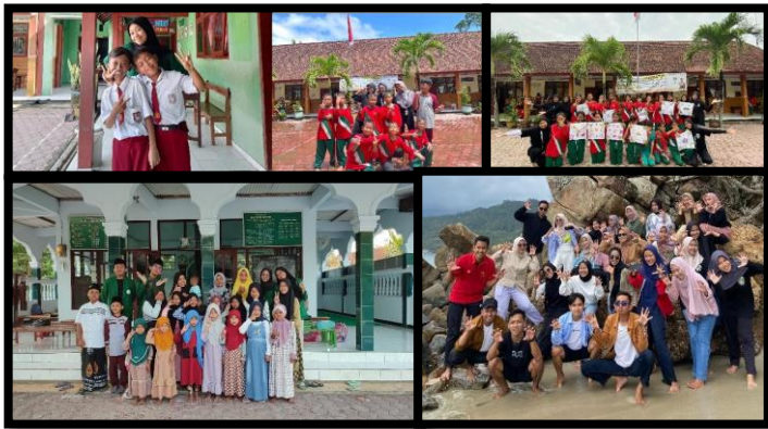
Gambar 8. Potret kebersamaan kelompok Karangnom 2