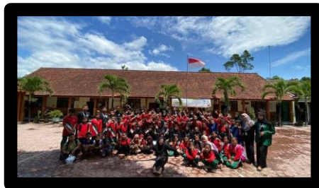
Gambar 6. Potret bersama siswa/i SDN 1 Karanganom

berkenan jika kita mengadakan bimbel untuk anak-anak SDN 1 Karanganom, dan alhamdulillahnya bapak kepala sekolah setuju bahkan meminta langsung kita para divisi pendidikan dan teknologi untuk ikut membantu ibu bapak guru mengajar di SD, singkat cerita kita mengadakan bimbel dan mengajar di sd nah untuk setiap hari sabtu untuk mengisi kekosongan di SD tersebut kita mengadakan sosialisasi, ecoprint, ecobrik, serta lomba-lomba untuk memperingati isra' mi'raj dan penutupan KKN kita, salah satu hal yang berkesan disaya adalah pada saat mengadakan lomba di SD dimana semua teman-teman Karanganom 2 membantu divisi pendidikan & teknologi dalam mensukseskan acara, lomba tersebut dibagi menjadi 2 yaitu kasar dan halus lomba kasar terdiri dari estafet air, gobak sodor, cokot koin, dll sedangkan untuk yang halus itu terdiri dari lomba adzan dan menyanyikan lagu religi. Mengapa saya bilang ini adalah salah satu momen yang berkesan karena kersamaan kita dilihat dari sini dimana kekompakan, kekeluargaan kita dilihat disini dan yang pasti membuat happy semua orang, dari adek-adek SDN 1 Karanganom, Guru-guru SDN 1 Karanganom dan semua teman-teman Karanganom 2.