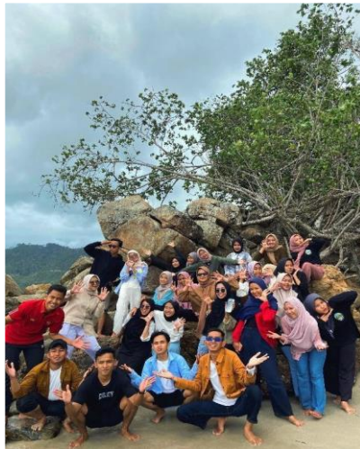
Gambar 1. Potret Kebersamaan di Pantai Mutiara, Kabupaten Trenggalek