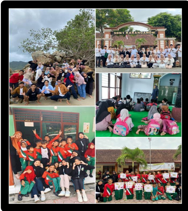
Gambar 9. Potret kebersamaan di beberapa kegiatan