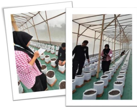
Gambar 2. Pengelolaan lahan di Manajemen Tanaman Sehat Desa Karangnom

Potret di atas merupakan satu dari sekian upaya yang kami lakukan untuk menciptakan benang merah mengenai keluarga mashlahat, yaitu menggunakan pendekatan alam. Sekali lagi, Karangnom memiliki 1001 pesona yang sangat sayang apabila dibiarkan begitu saja. Salah satu potensi yang sedang dalam masa penggarapan yaitu pengelolaan lahan persawahan menjadi area Agrowisata. Program ini dinamakan Manajemen Tanaman Sehat (MTS) yang tengah menjadi program unggulan di Desa Karangnom. Dalam kegiatan wawancara dan praktik secara langsung bersama pihak pengelola, pengelolaan tanaman yang berada di wilayah MTS sudah menggunakan teknologi smart farming dengan sistem pertanian hydroponic. Adapun tujuan pemberdayaan masyarakat melalui MTS ini ialah, untuk memberikan contoh maupun pembelajaran bagi warga setempat mengenai manajemen tanaman yang baik hingga