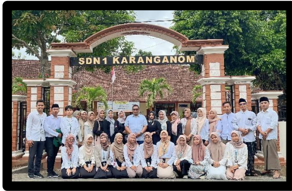
Gambar 5. Potret bersama dewan guru SDN 1 Karanganom

Penutupan semester 5 ini kami seluruh mahasiswa diwajibkan mengikuti KKN. Sudah tak asing lagi bahwa KKN merupakan salah satu bentuk nyata mahasiswa dalam berkecimpung di masyarakat. Di universitas ini, KKN diadakan menjadi 2 gelombang. Aku termasuk dalam gelombang 1 KKN Reguler Multisektoral. Dimulai dari aku yang tidak pernah jauh dari keluarga bahkan tidak pernah berpergian keluar kota sampai waktu yang lama, kini mau tidak mau aku harus pergi keluar kota untuk waktu yang lumayan lama, dan rasa takut itu pun terus menghantuiku. Tetapi setelah aku berdiskusi dengan