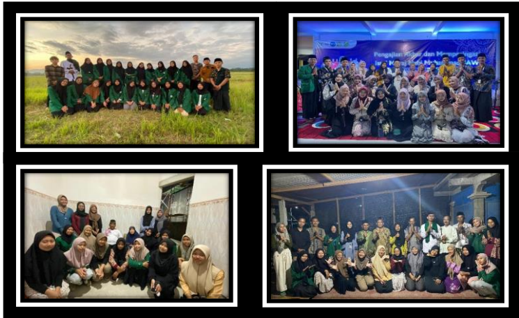
Gambar 7. Beberapa potret kegiatan KKN

"Titik Temu ini adalah awal dari cerita Keluarga Baru yang ditulis dengan tinta pengalaman dan kebersamaan"